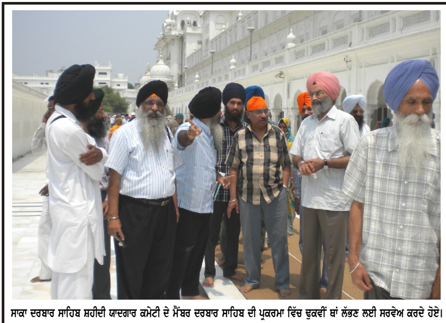
ਸਾਕਾ ਦਰਬਾਰ ਸਾਹਿਬ ਸ਼ਹੀਦੀ ਯਾਦਗਾਰ ਕਮੇਟੀ ਦੇ ਮੈਂਬਰ ਦਰਬਾਰ ਸਾਹਿਬ ਦੀ ਪ੍ਰਕਰਮਾ ਵਿੱਚ ਢੁਕਵੀਂ ਥਾਂ ਲੱਭਣ ਲਈ ਸਰਵੇਖ ਕਰਦੇ ਹੋਏ।